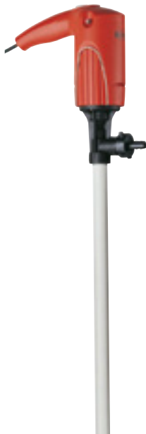
JUNIORFLUX F 310 (voir page 4)