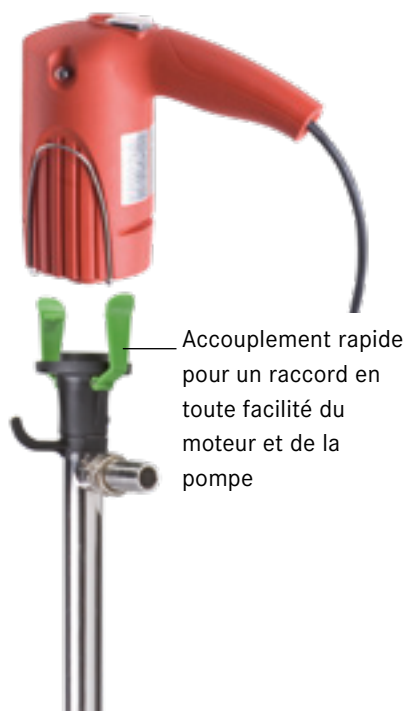
COMBIFLUX avec FEM 3070

La petite pompe vide-fûts sans garniture d'étanchéité COMBIFLUX FP 314 peut être utilisée par exemple avec le moteur à collecteurs FEM 3070 (avec raccordement au réseau). Elle est conçue selon un principe modulaire de telle sorte qu'il est possible de faire fonctionner plusieurs pompes les unes à la suite des autres avec un seul moteur. Comme la pompe JUNIOFLUX, la COMBIFLUX est également idéale pour le transfert de petites quantités en provenance de simples bidons jusqu'à des fûts de 200 litres. Le faible diamètre du tube extérieur permet un pompage à partir de récipients à ouvertures étroites.