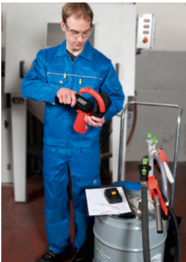
Interruption minimale du travail grâce à la batterie rechargeable.