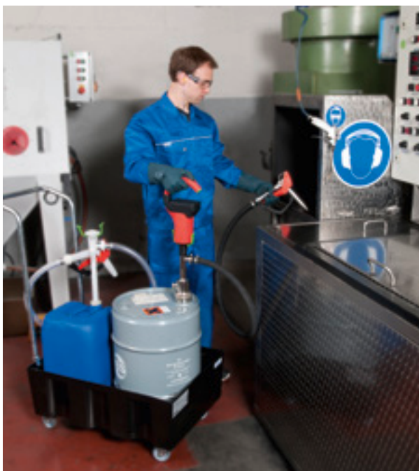
Grande mobilité grâce au moteur avec batterie.