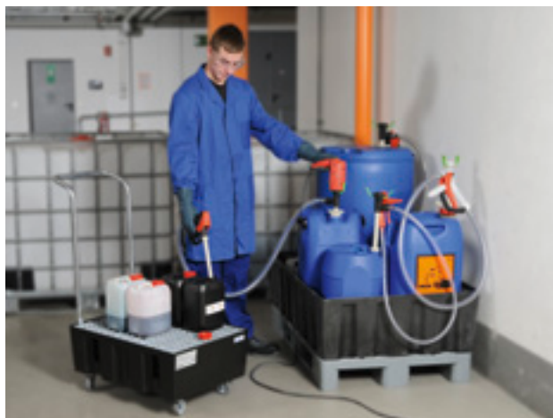
COMBIFLUX – Transfert de différents fluides avec plusieurs pompes et un moteur relié par câble FEM 3070.

* mesuré avec de l'eau sur la tubulure de refoulement (20 °C) dépend du matériau du tube extérieur.