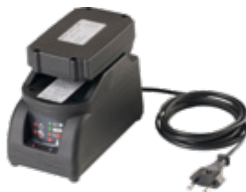
Batterie entièrement rechargée en 55 minutes seulement.