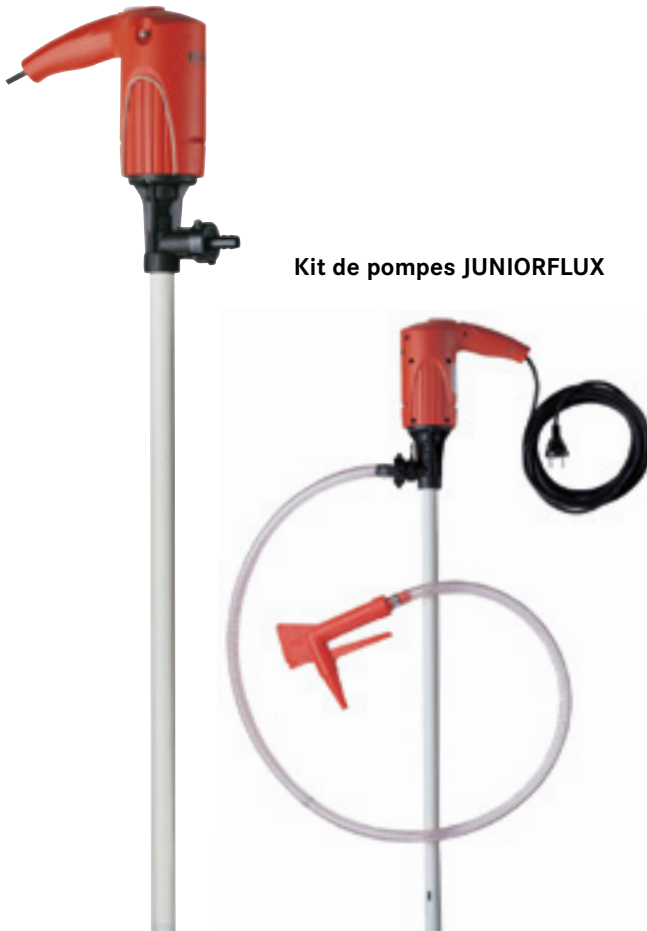
Kit de pompes JUNIORFLUX