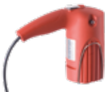
Moteur FEM 3070 (voir page 5)