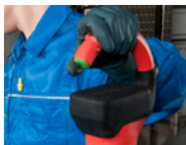
Performance de pompage variable grâce au réglage continu de la vitesse de rotation.