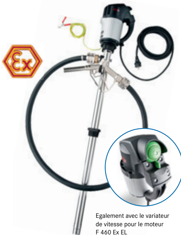
Egalement avec le variateur de vitesse pour le moteur F 460 Ex EL

En utilisant la pompe avec un tuyau flexible et un pistolet de remplissage, le débit max. sera 50 l/min. *, viscosité max. 800 mPas, température max. 100 °C (en zone Ex, max. 40 °C), hauteur de refoulement max. 13 mCE.